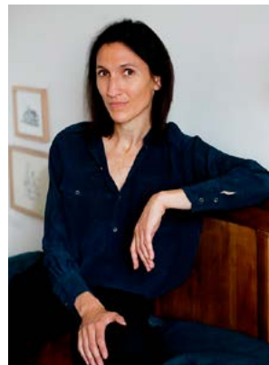
Catherine Meurisse